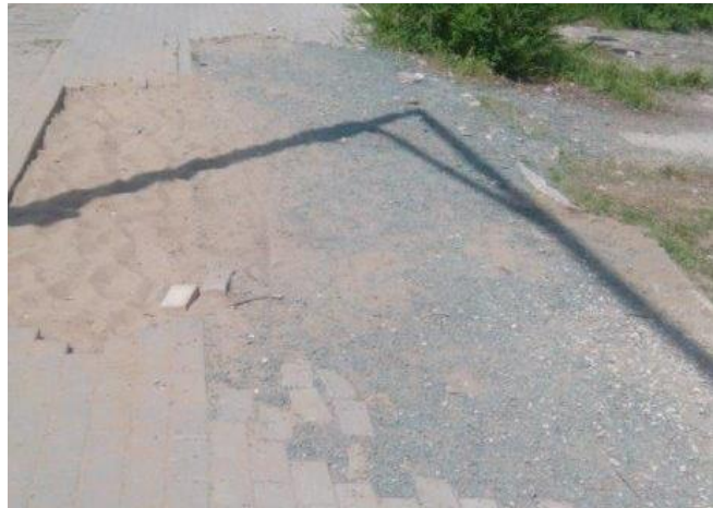
Фото объекта «До»

Общественный совет р-на: Бурушина Н.А. т.89171271751