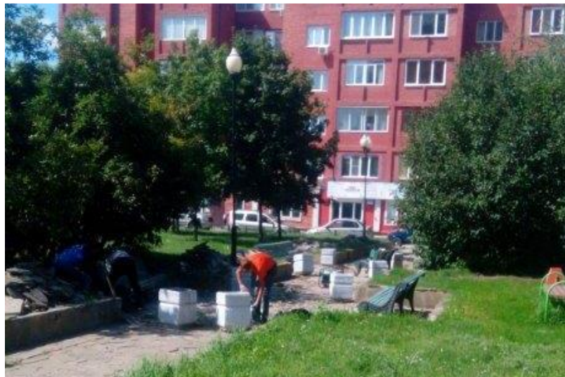
Фото объекта «В работе»