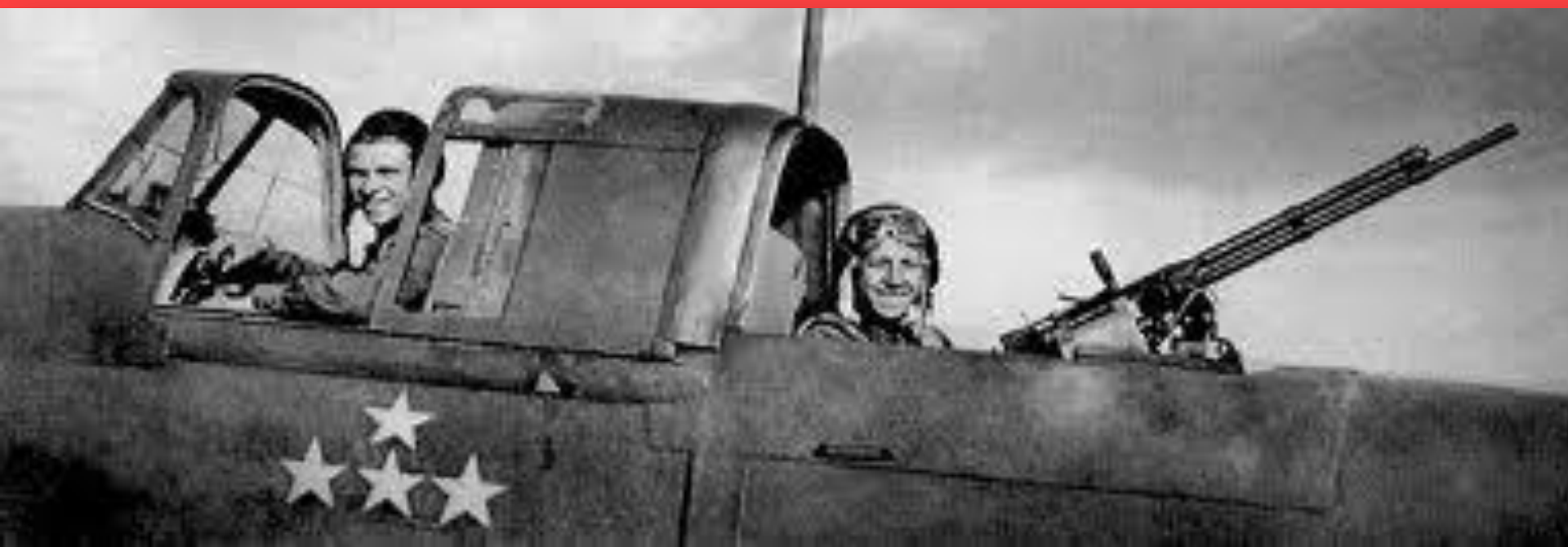
Экипаж штурмовика ИЛ-2