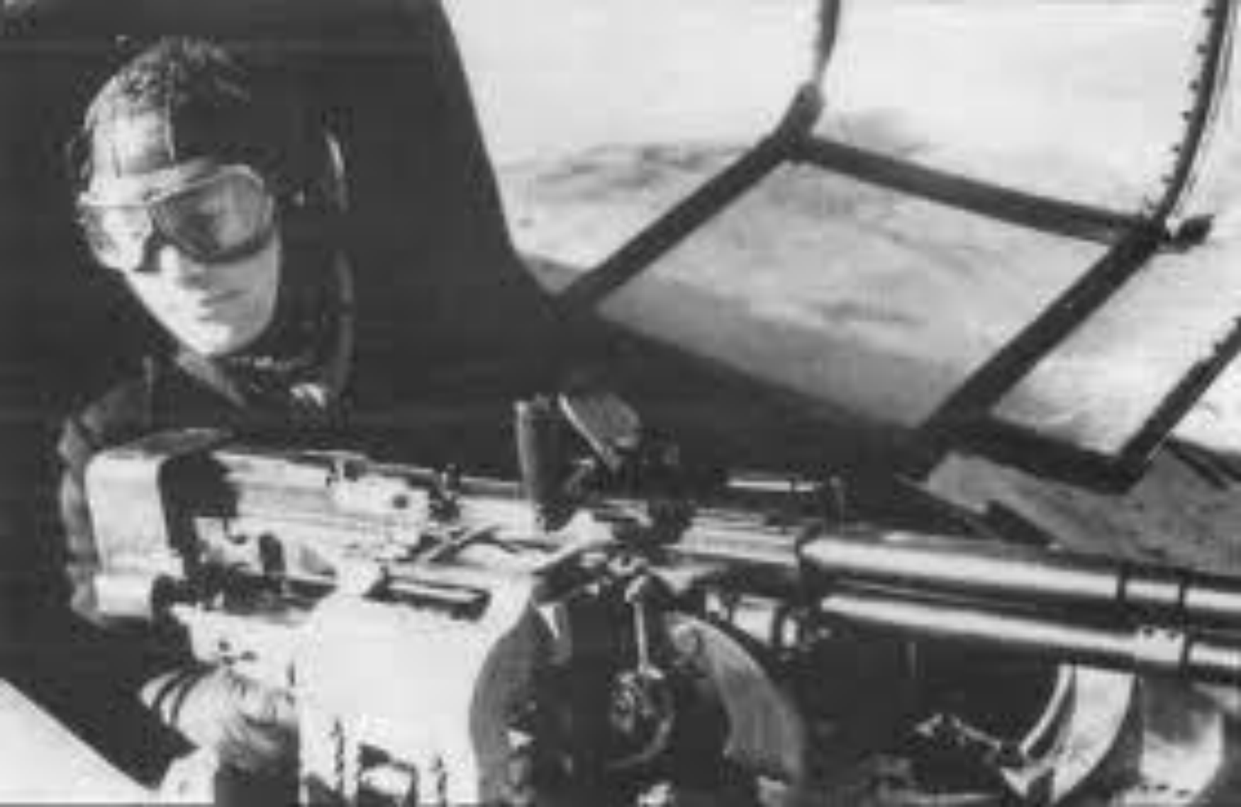
Бортстрелок на штурмовике ИЛ-4