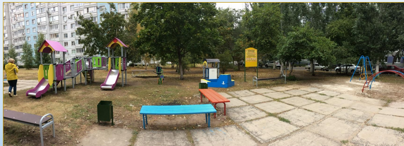
Фото объекта «После»