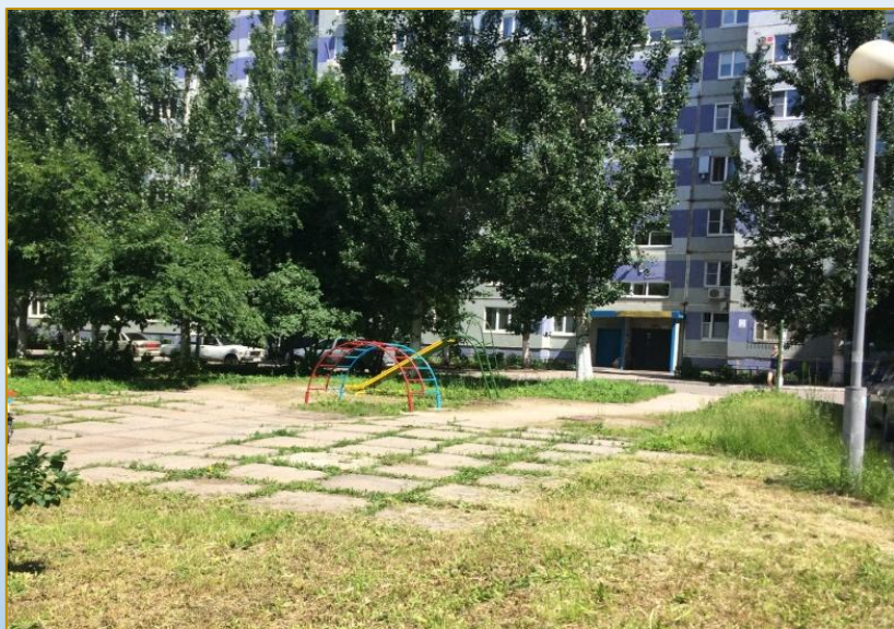
Фото объекта «До»