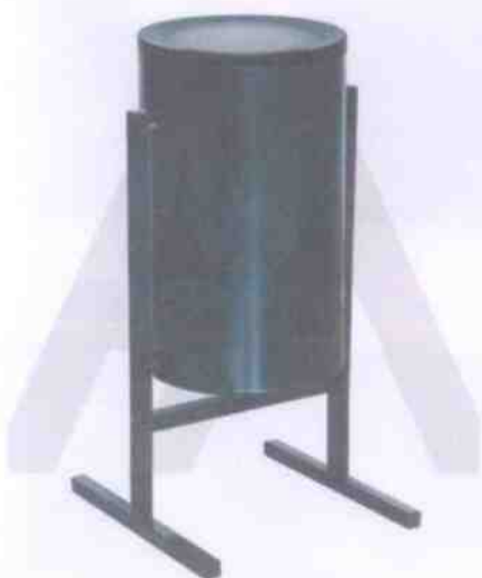
Урна ПЛ-160314 (1882р) (1шт.)