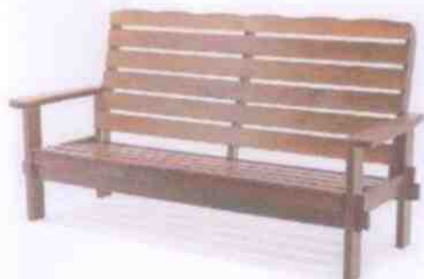
Садовый диван (5253р) (1шт.)