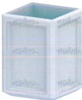
Урна мф 6.08 (1шт.) бетонная 440x440x600