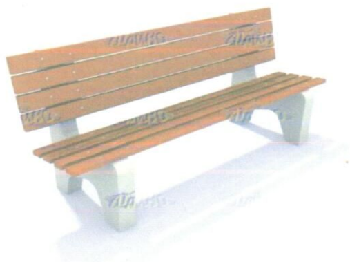
Лавочка МФ 1.14 (1шт.) 2000 x 680 x 900