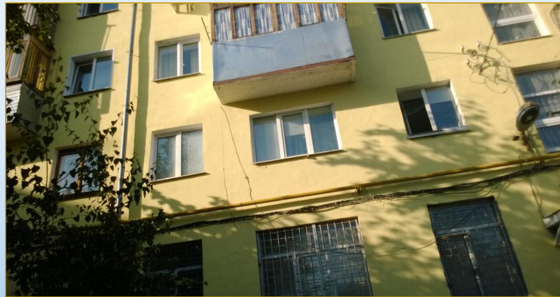
Фото объекта «После»