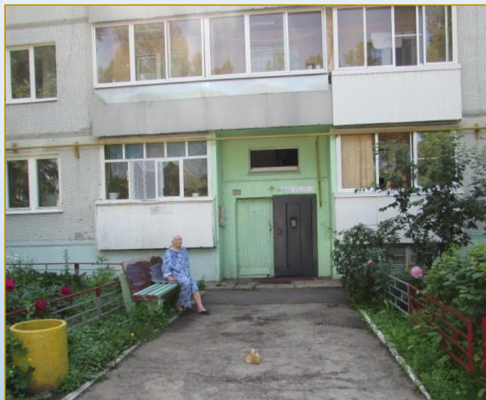
Фото объекта «До»