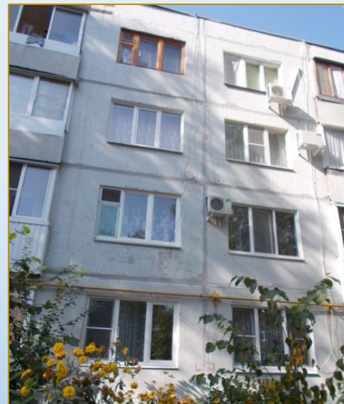
Фото объекта «После»