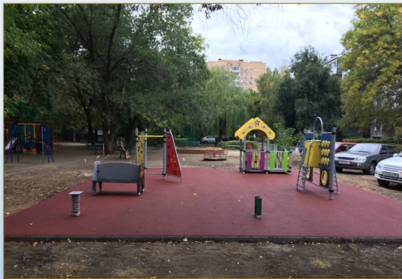
Фото объекта «В работе»