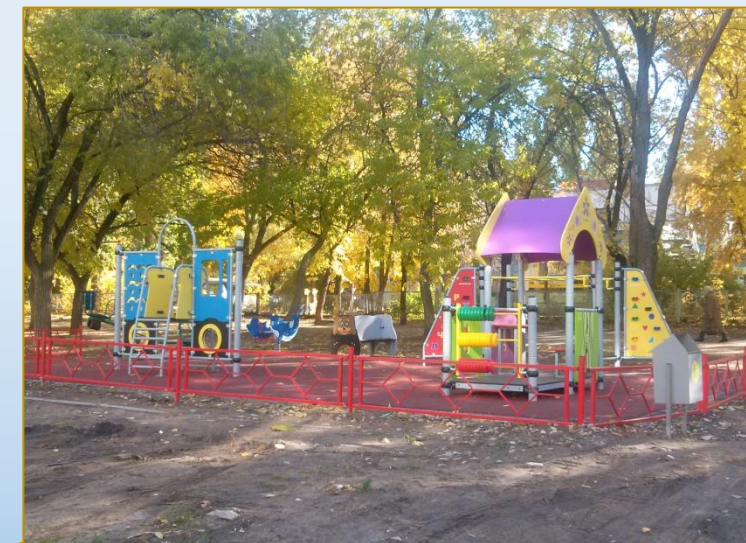
Фото объекта «После»