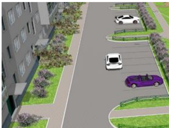
Произвольный вариант проекта