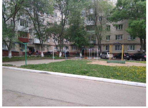
Фото объекта «До»