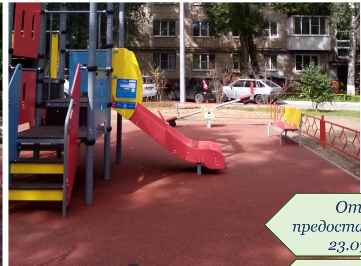
Фото объекта «После»