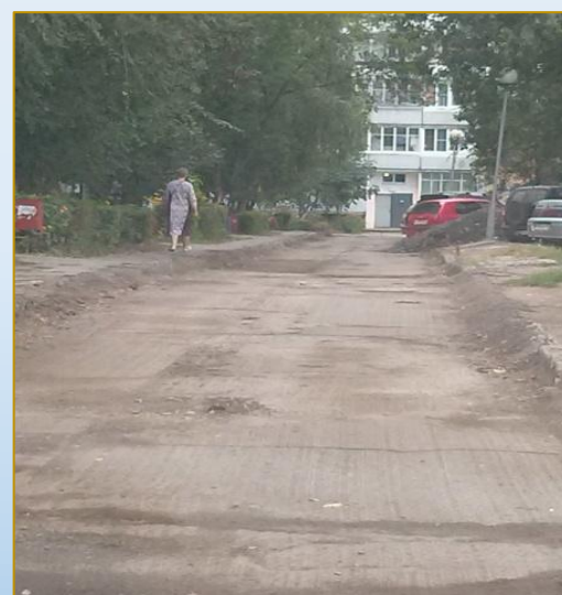
Фото объекта «В работе»