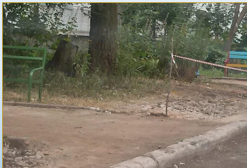
Фото объекта «До»