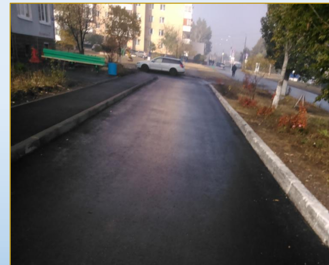
Фото объекта «После»