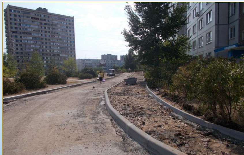
Фото объекта «В работе»