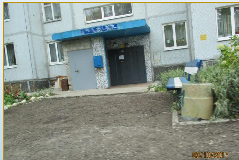
Фото объекта «В работе»