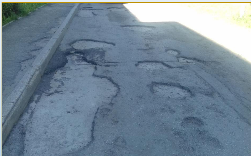
Фото объекта «До»