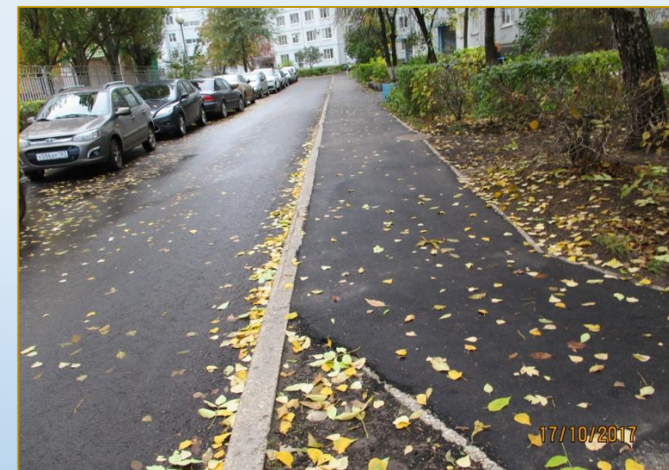
Фото объекта «После»