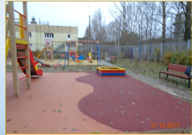
Фото объекта «После»