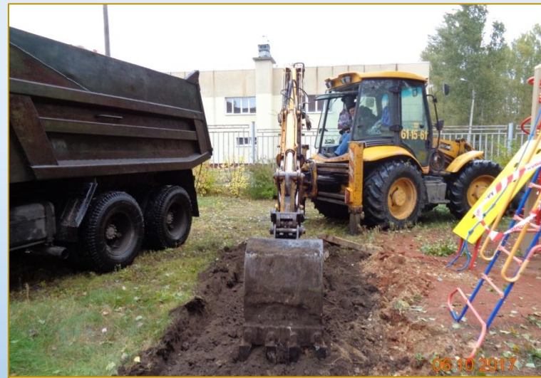
Фото объекта «В работе»