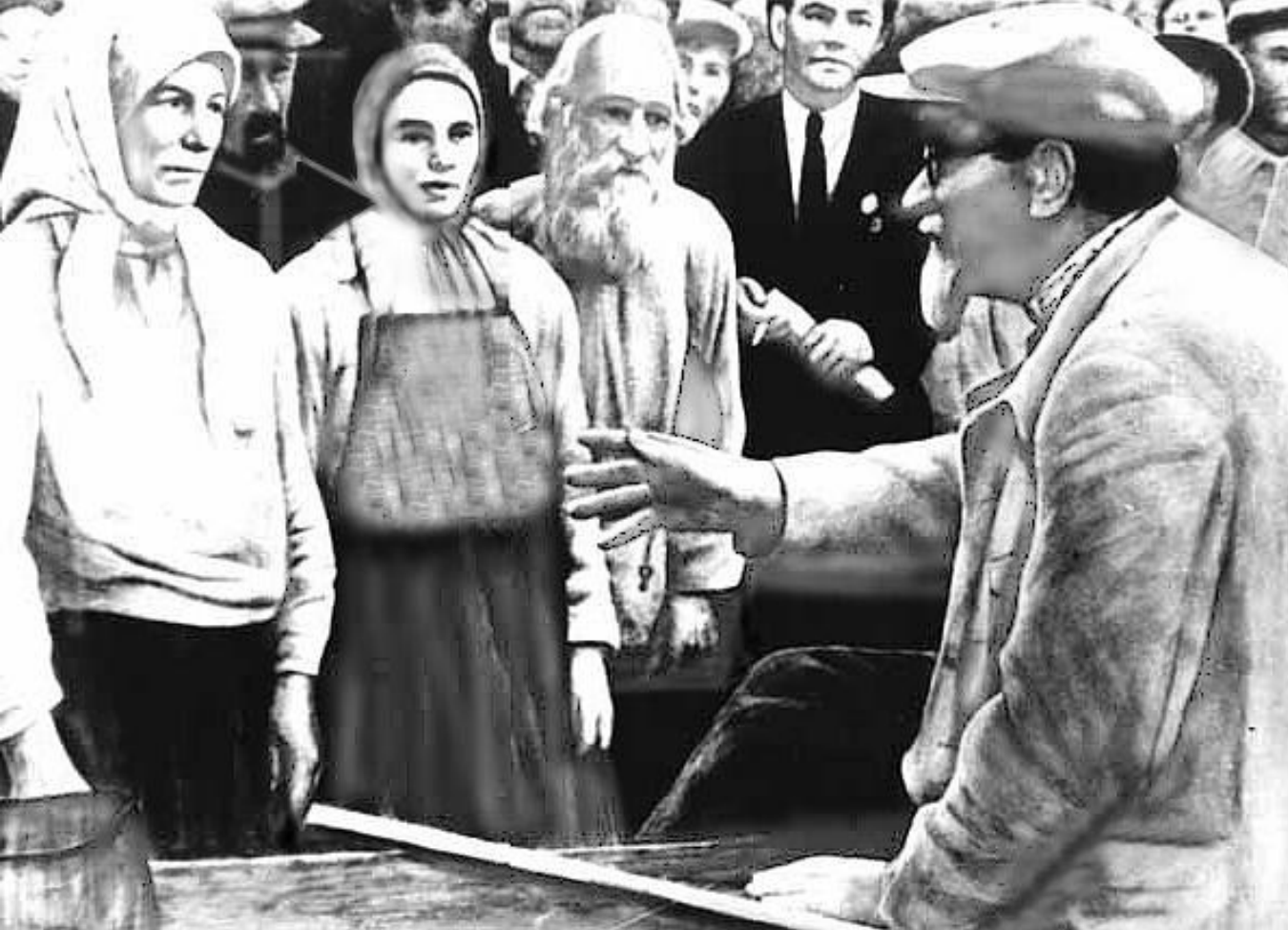
Колхоз «Красный Октябрь». Слева направо: В.П. Шубриков, М.И.Калинин. 8 июля 1936 г. Калинин дал колхозникам практические советы по ведению мелиоративного земледелия.