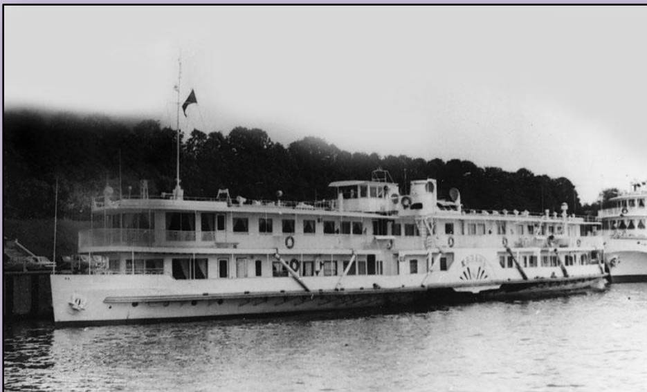
Прибыл М.И.Калинин в Ставрополь на пароходе «Казань»