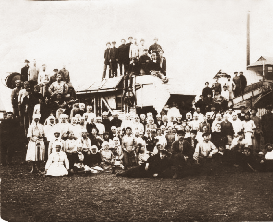
На полевом стане