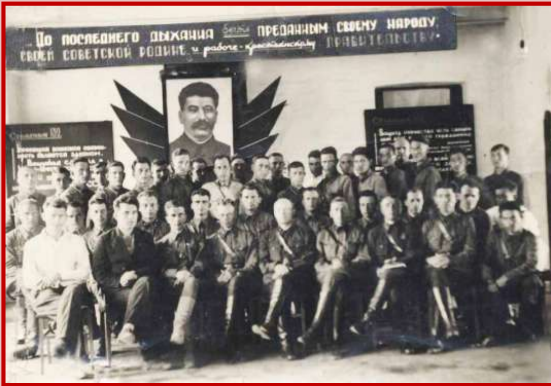
Бойцы РККА в Монголии. 1938 г.