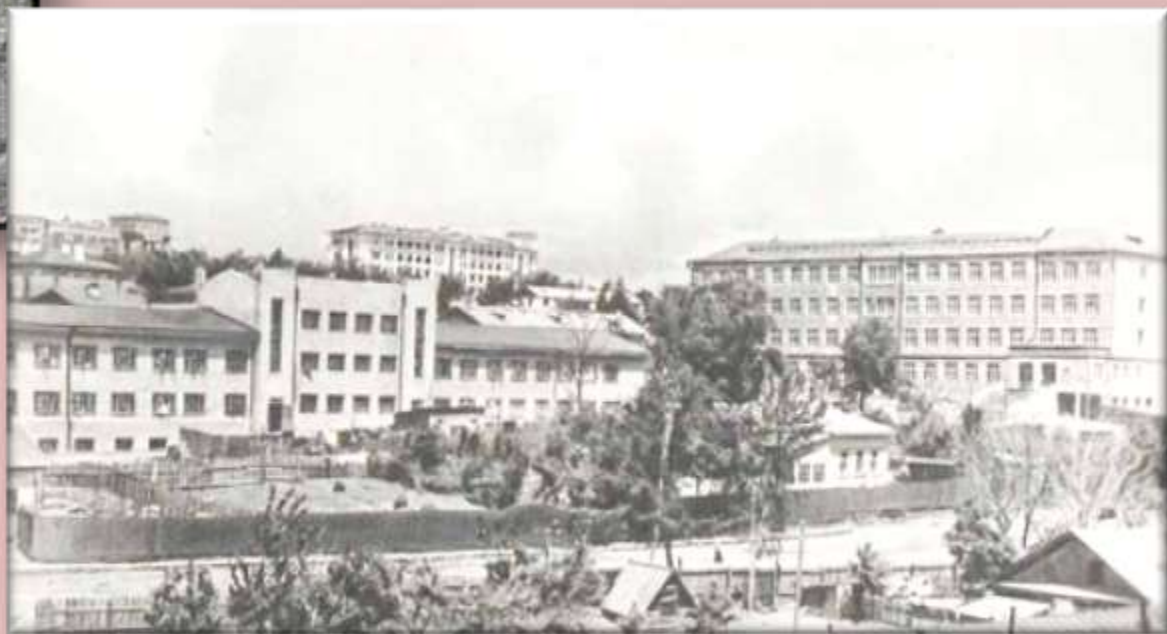
Хабаровск. 1941 г.