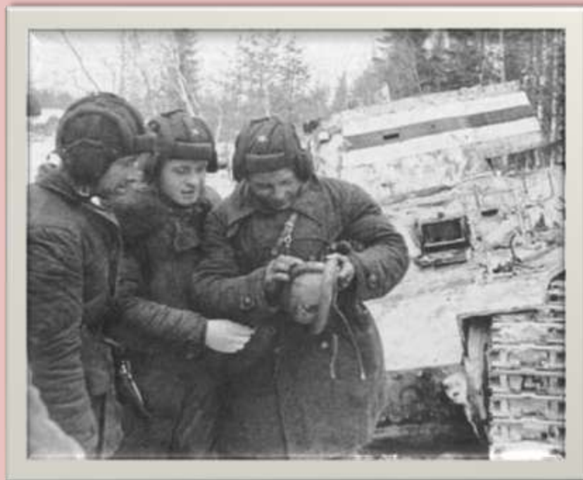
Танкисты РККА. Монголия. 1938 г.