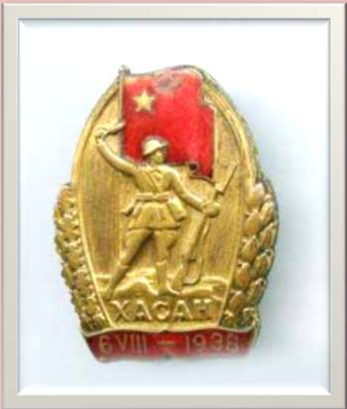
Нагрудный знак участника боев на озере Хасан. 1938 г.