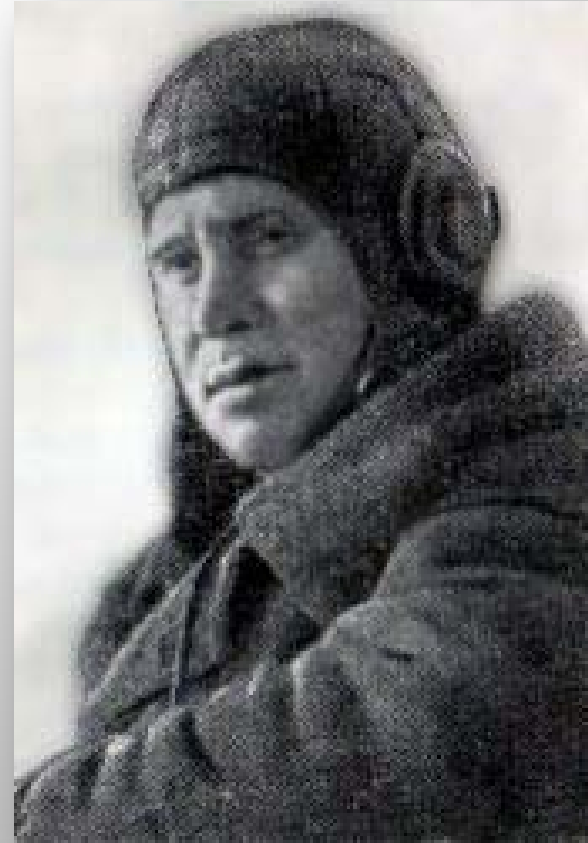
Герой Советского Союза летчик Алексей Иванович Грачев.