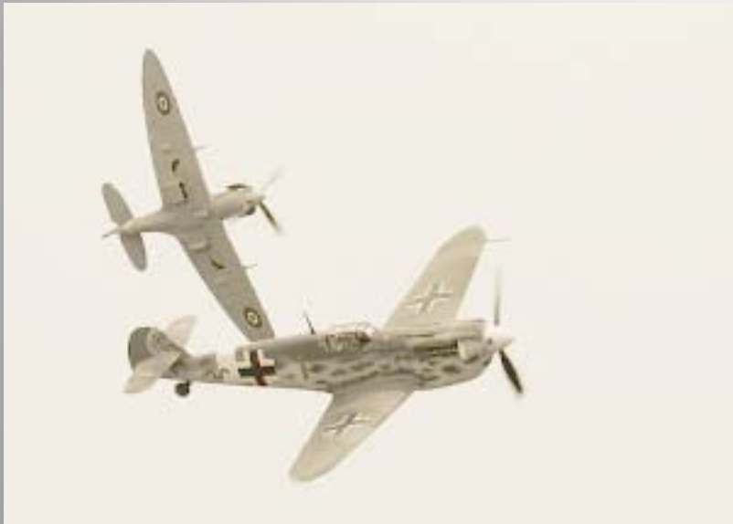
Бой ведут мессершмидты М-109