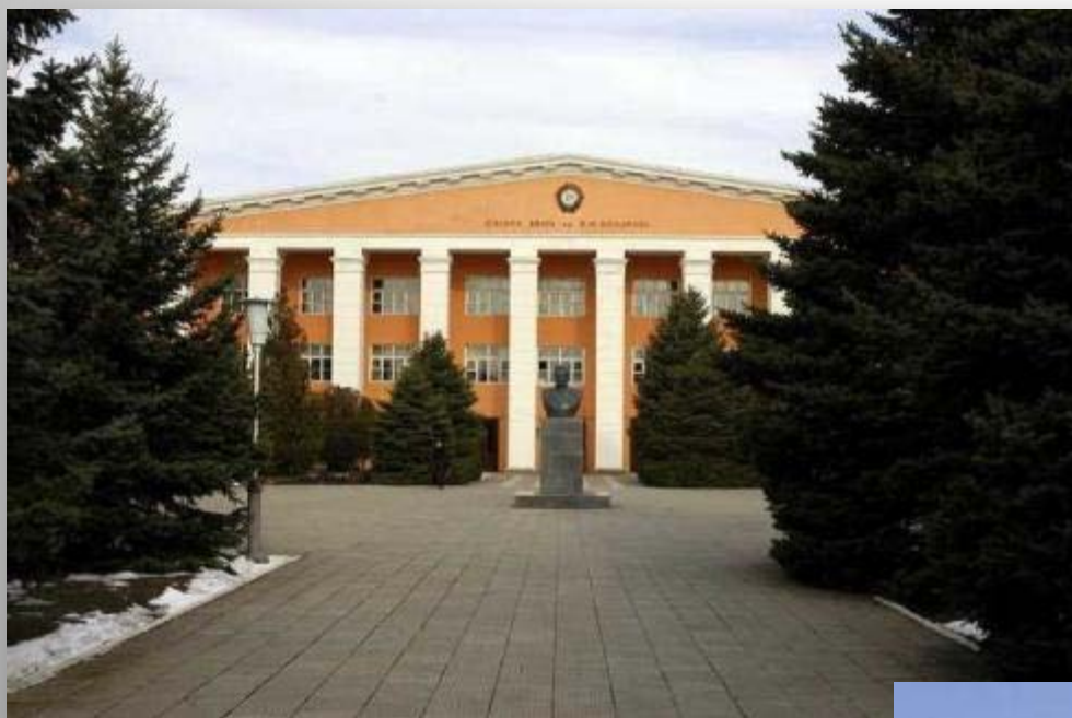
Ейское авиационное училище