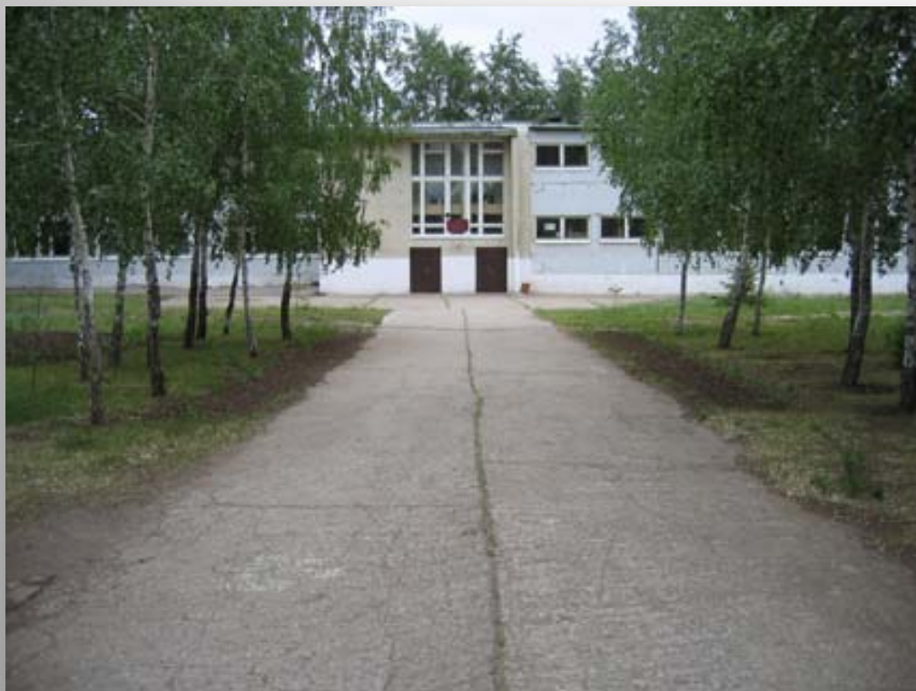
Школа имени А.И.Грачева в Ягодном