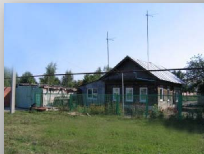
Улица А.И. Грачева в с. Ягодное Ставропольского района Самарской области.