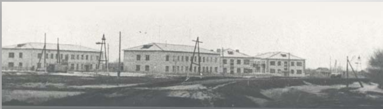
С. Ягодное, 1985 г.