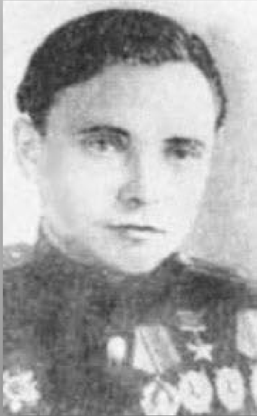
Герой Советского Союза штурман Григорий Иванович Давиденко