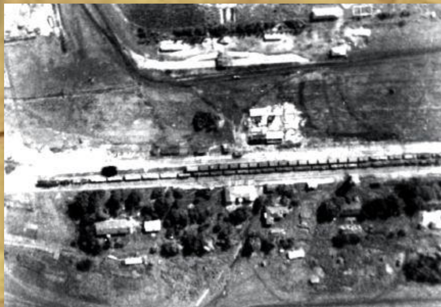
Бомбардировка железнодорожного эшелона