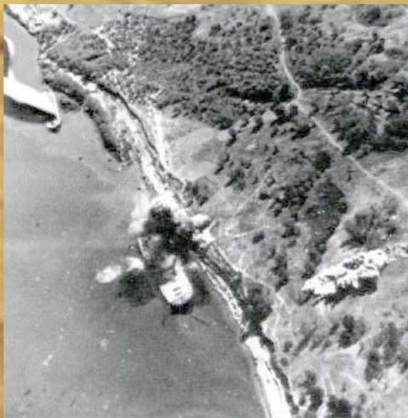
Бомбардировка речного судна