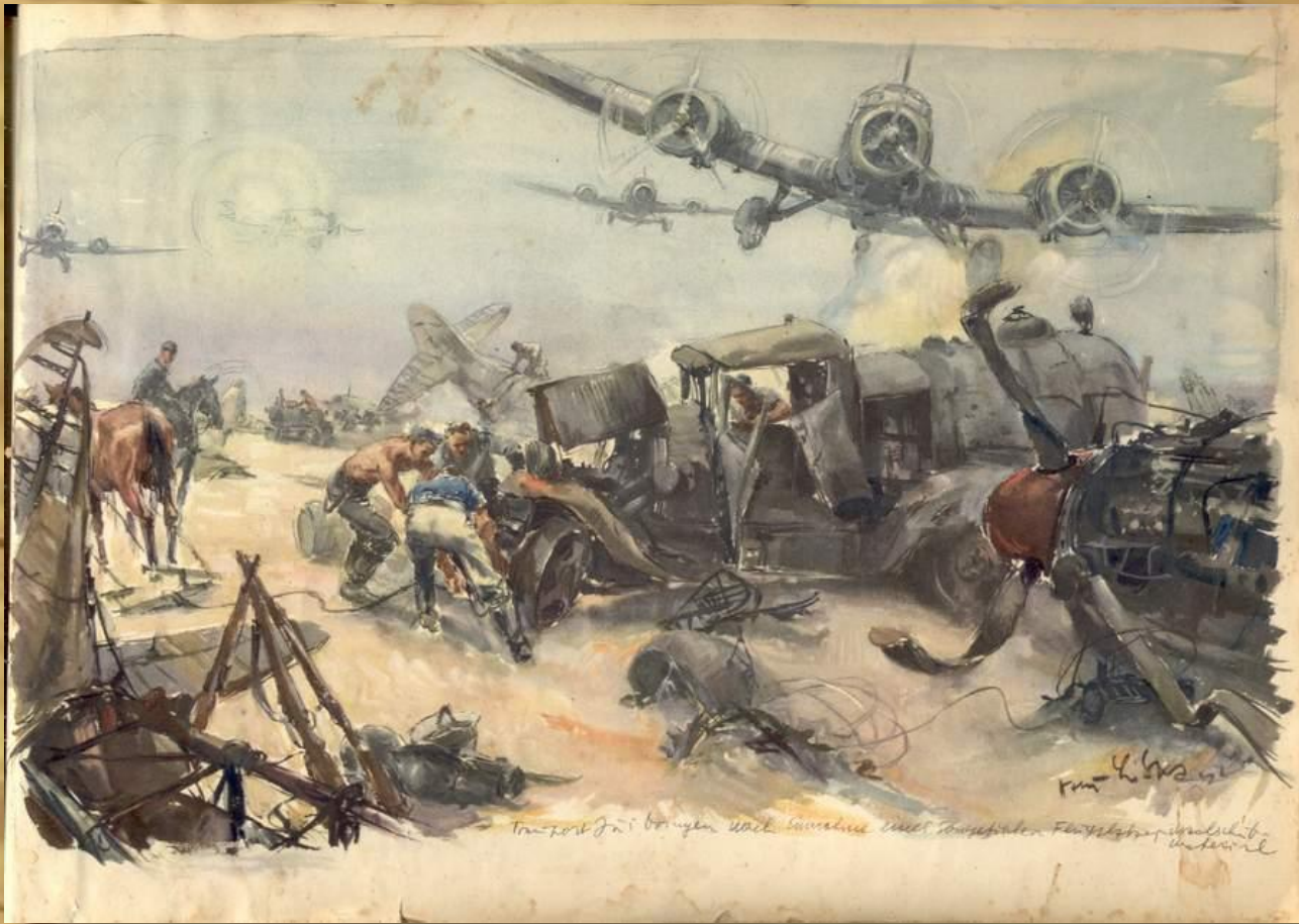
Зарисовки из фронтового альбом немецкого летчика