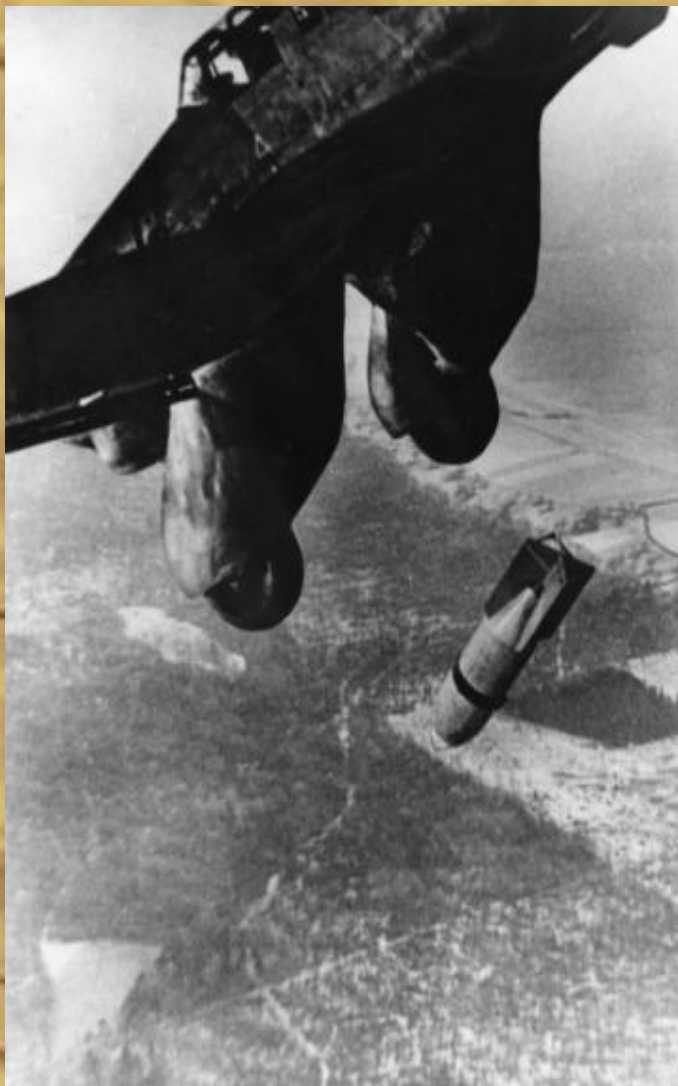
Прицельное бомбометание с немецких самолетов