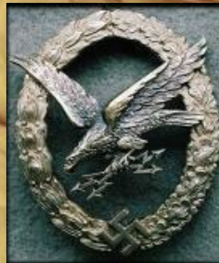
Значок немецкого летчика