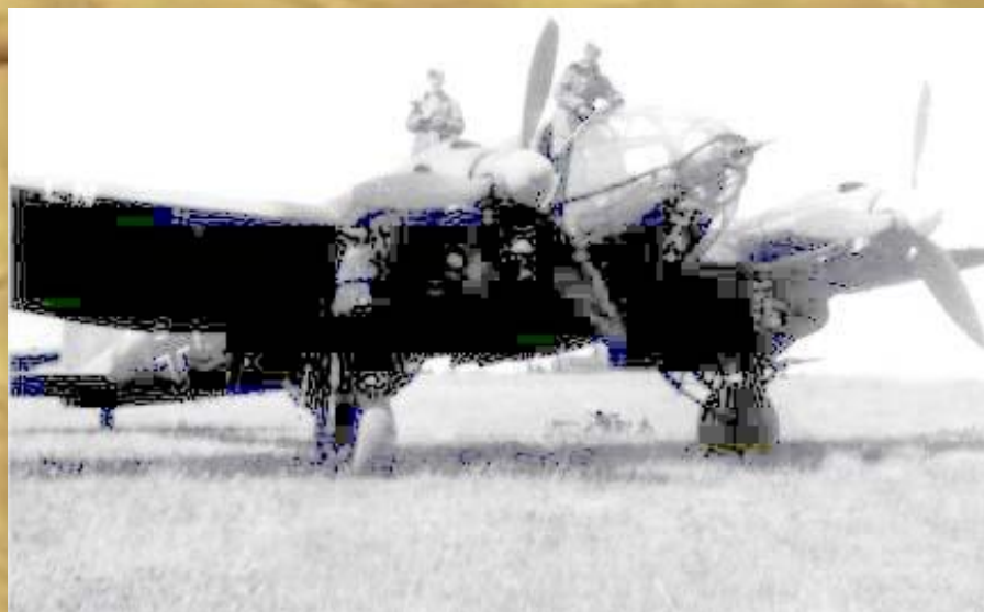
Хенкель - 111