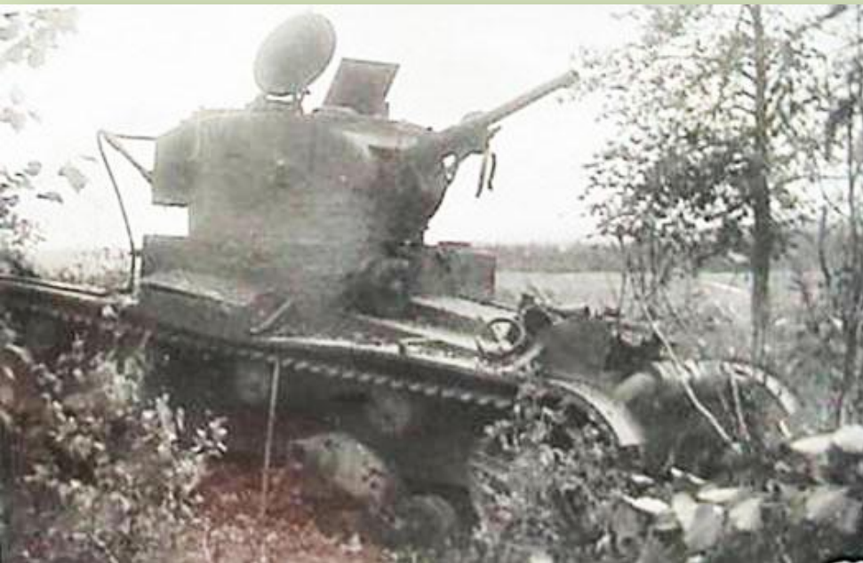
Советский танк, подбитый под Невелем.