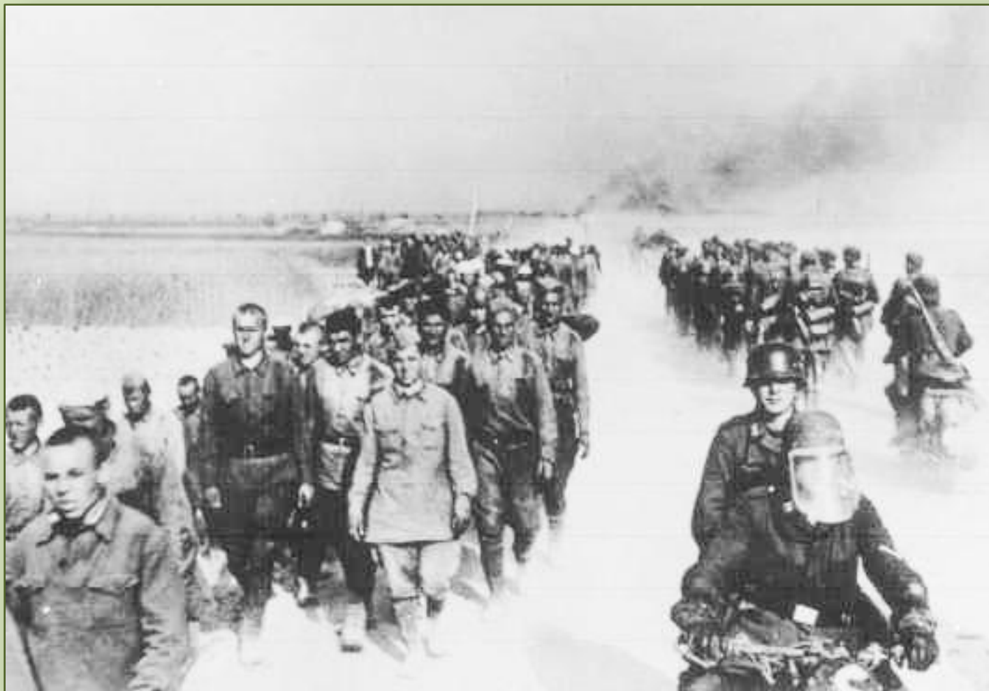
Советские военнопленные под Невелем.1941