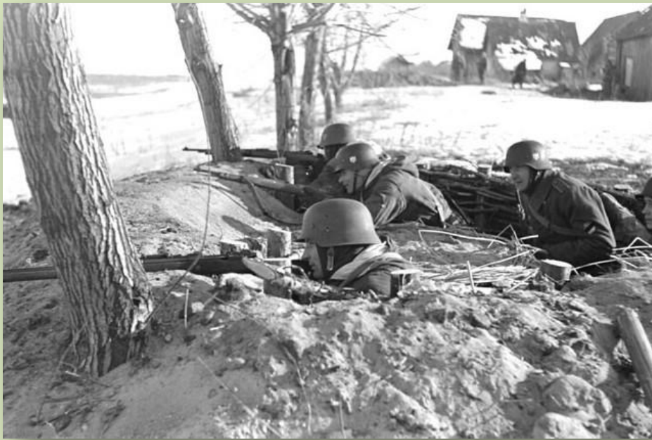
Себеж. Немецкие окопы, 1944 г.