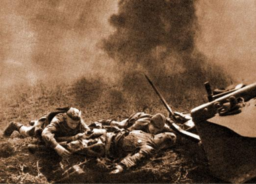
Доставка захваченного пленного