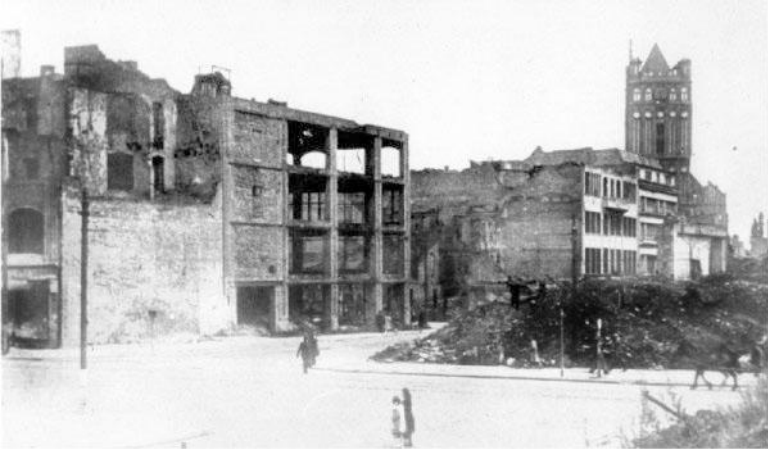
Штеттин. 1944 г.