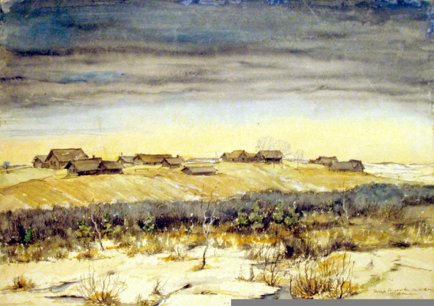
Старая Пустошка. Рисунок Ф. Дитмана. 1944 г.