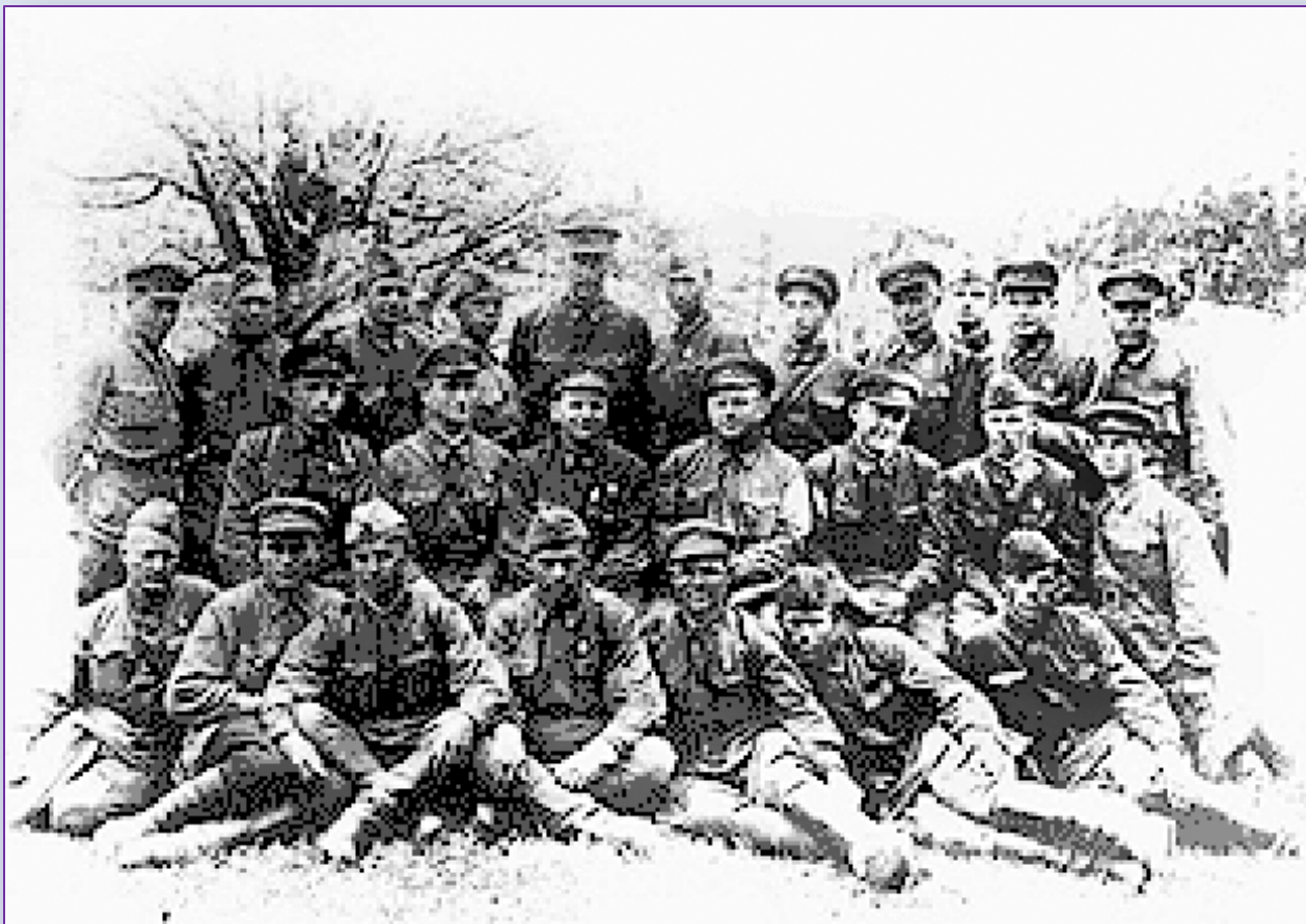
Штаб 12-й гвардейской стрелковой Пинской дивизии. Июнь 1942 г.