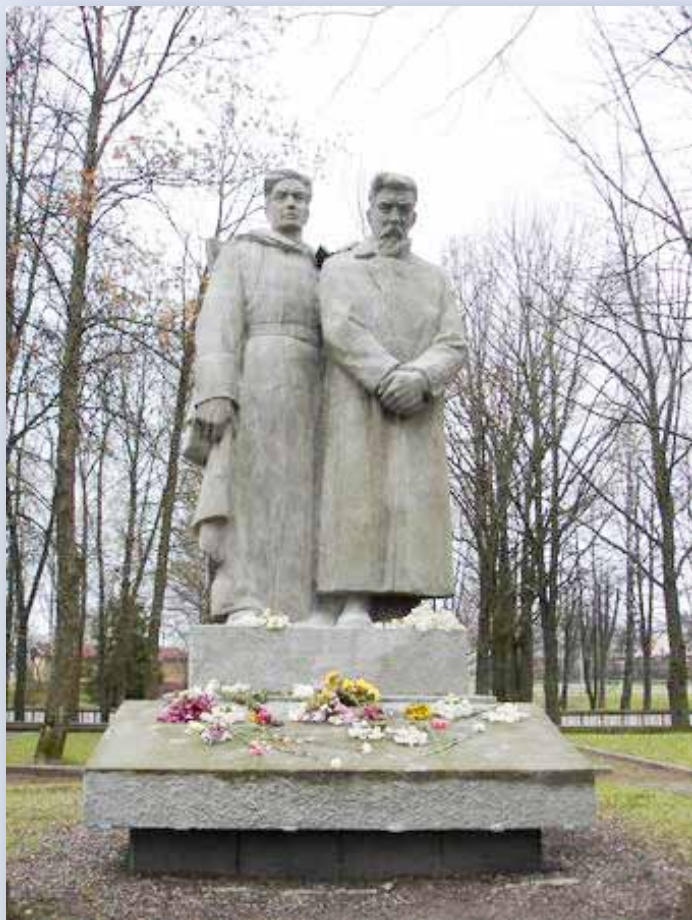
Мемориал на кладбище Добиле, где похоронен Н.С.Кошелев

Схема воинских захоронений расположенных на кладбище погибших военно- служащих 64 в. стр. полка Увеличена с карты 1:25000 0-34-131-Б-а