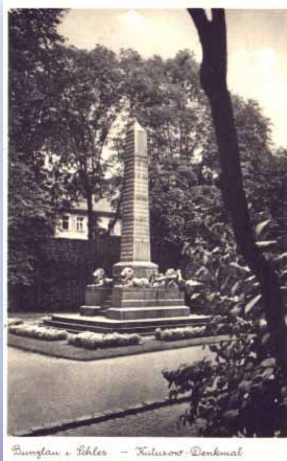
Bunzlau s. Löhles - Kutuzow-Denkmal