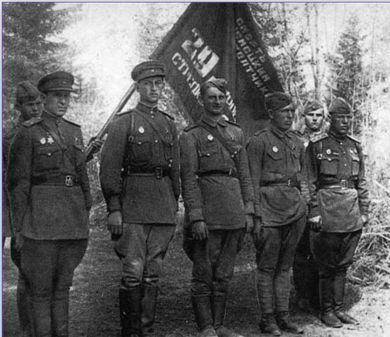
Знамя гвардейской 29-й Ельнинской стрелковой дивизии. 1943 г.