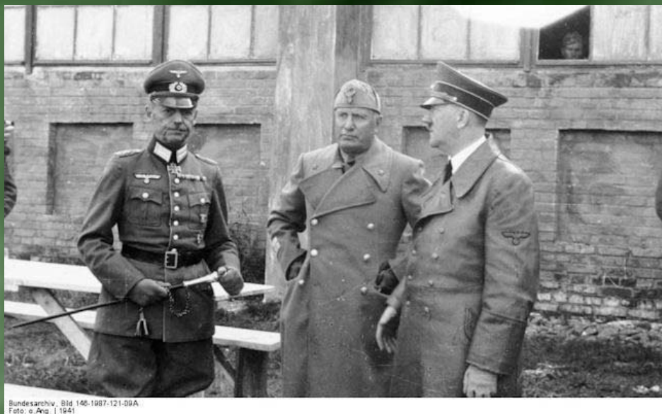
Райхенау, Менсон, Гитлер. 1943 г.

Командующий дивизией СС «Адольф Гитлер» Генерал-фельдмаршал Вальтер фон Райхенау