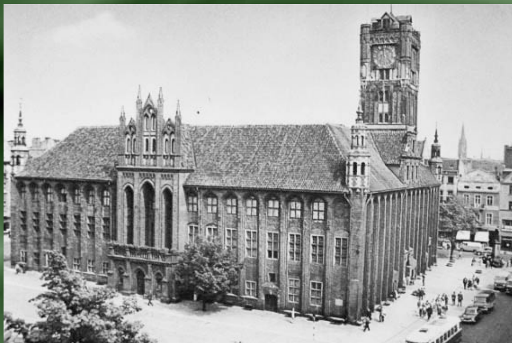
г. Торунь. Польша.