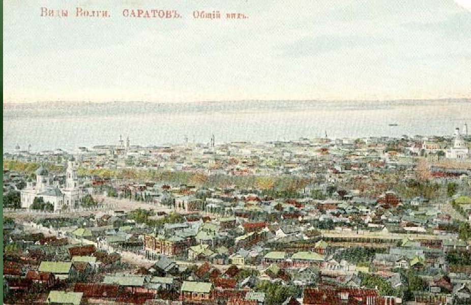
Виды Волги. САРАТОВЪ. Общій видъ.