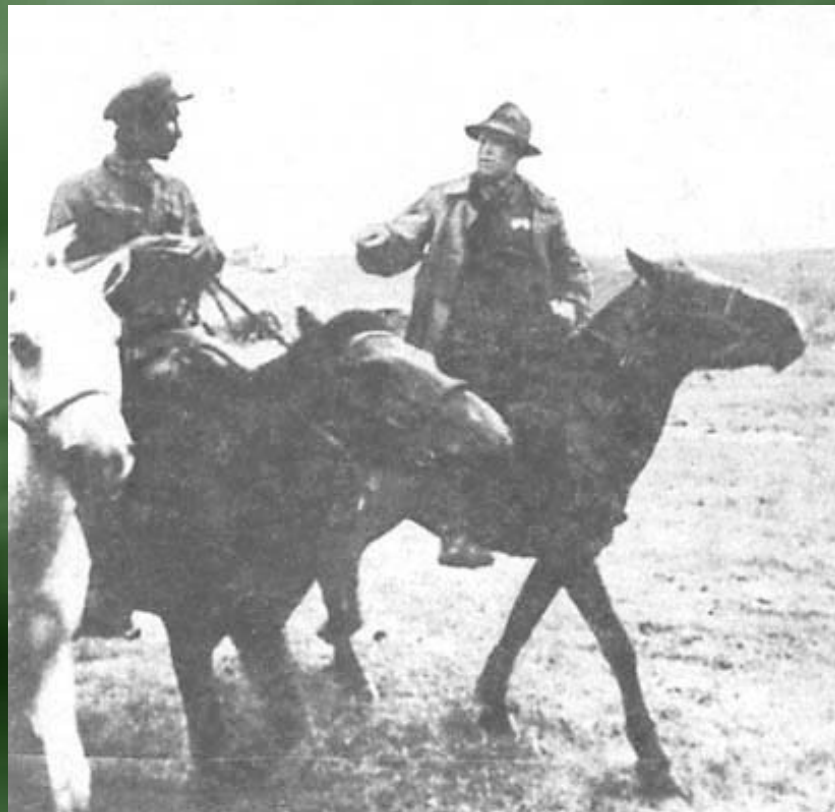
Г.К. Жуков в Монголии.